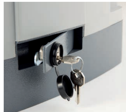
Manual release system Sblocco manuale Déblocage manuel