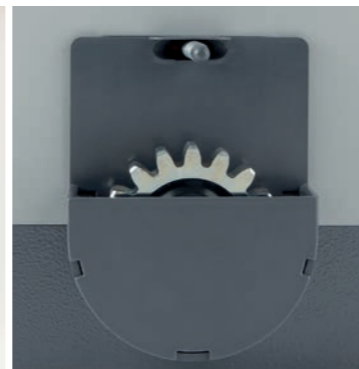
Long lasting gears Ingranaggi lunga durata Engrenages longue durée